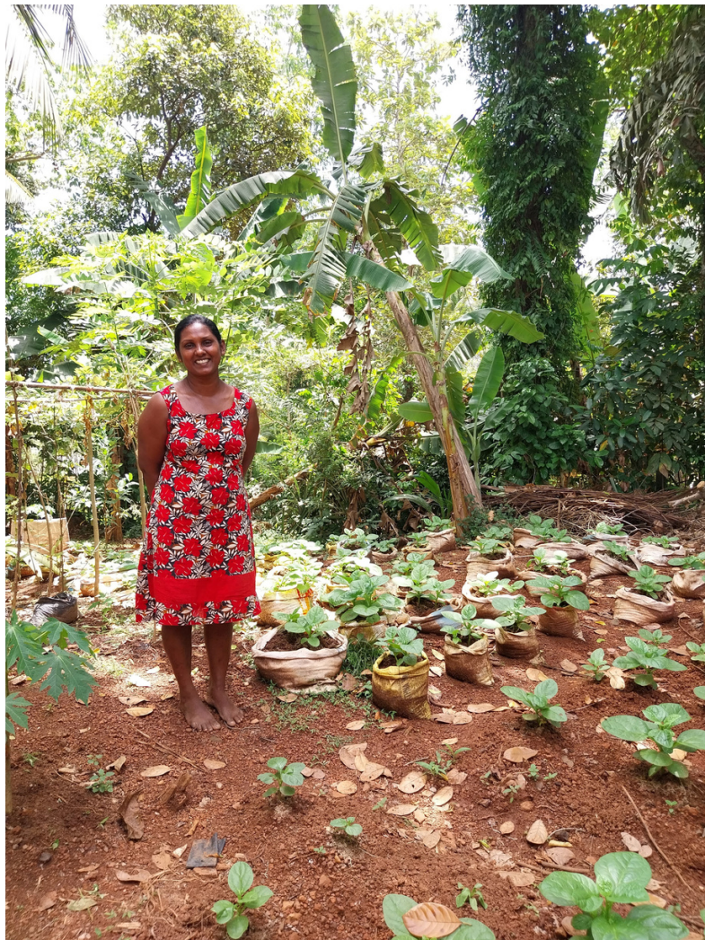
Feltbesøg i Kottawatta, Matara, Sri Lanka, marts 2023.

Budgettet for 2024 ser dog fornuftigt ud allerede nu, og vi mangler stadig svar på flere ansøgninger.