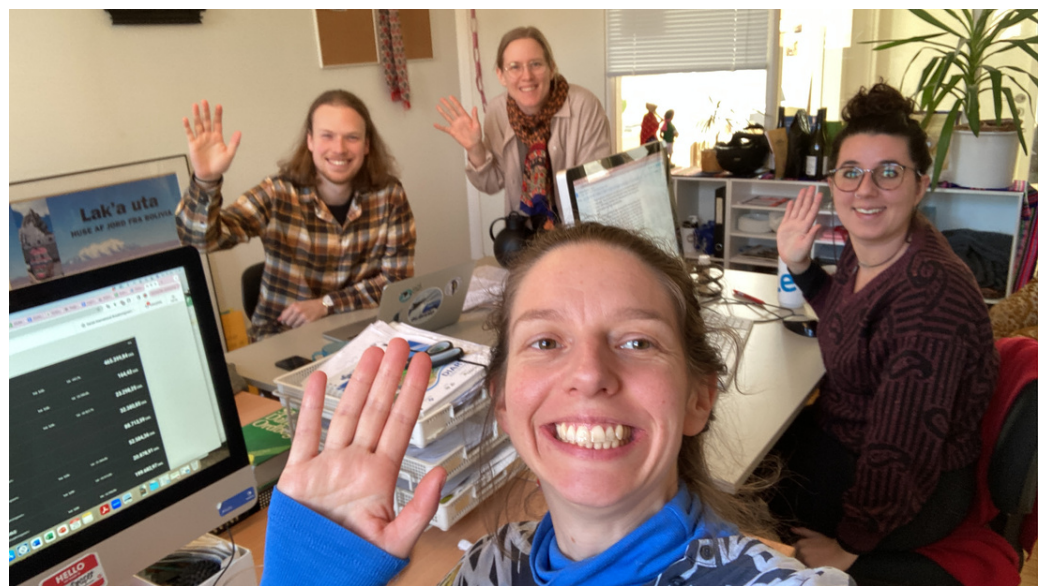
Fuld fart fremad - 2024 here we come!

Efter to workshops i 2023 med god deltagelse fra alle lag af DIB ser vi frem til at fortsætte workshop-forløbet om DIBs profil med Jacob i 2024.