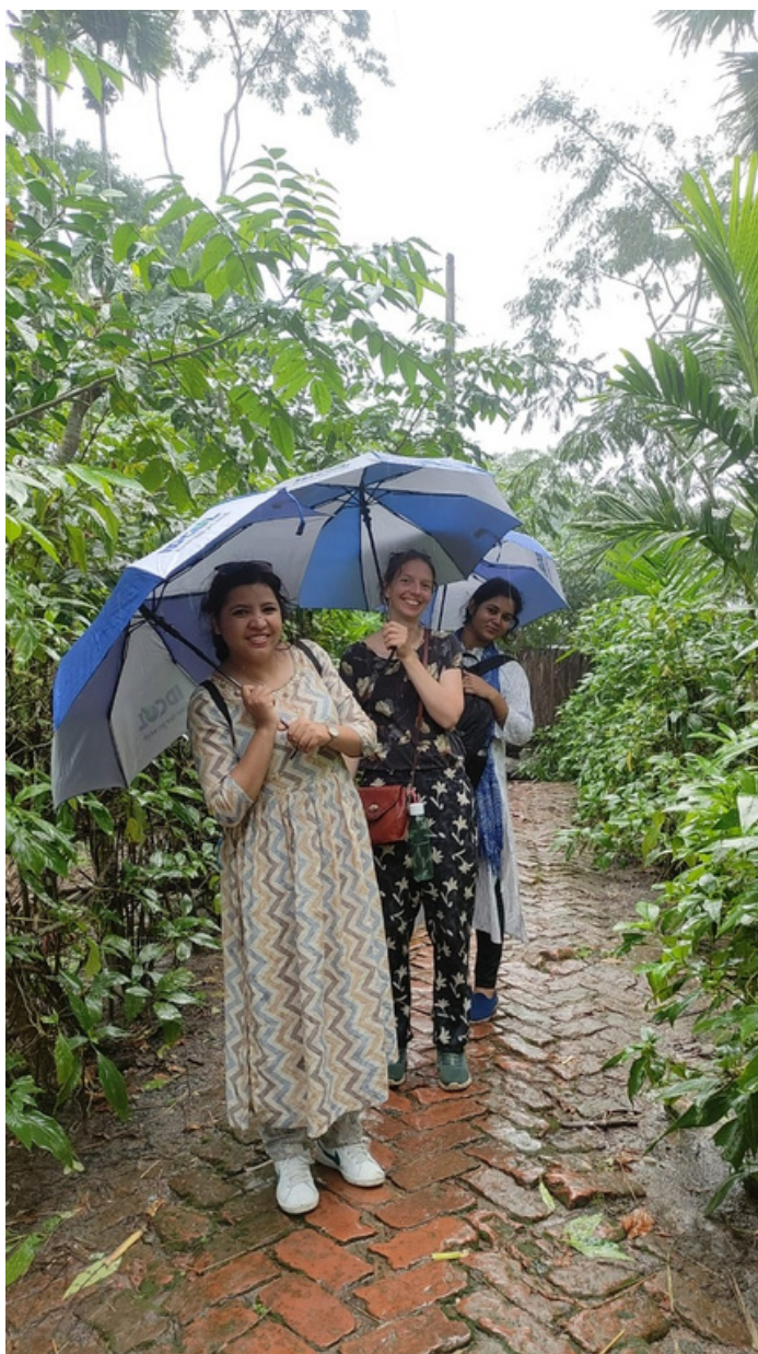
Feltbesøg til Majherchar sammen med EVD-partnerne, Bangladesh, oktober 2023