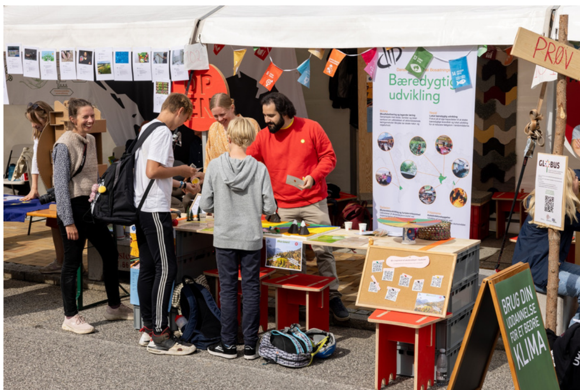
Klimafolkemødet i Middelfart, august 2023.

Vi er i 2023 lykkedes med at nå flere på vores profiler på de sociale medier, da vi nu er over 528 følgere på Facebook (fra 440), 173 følgere på Instagram (fra 142) og 292 følgere på LinkedIn (fra 230).